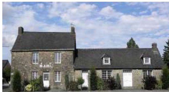
L'école primaire Robert Doisneau (St Georges Buttavent) deviendra école bilingue à la rentrée 2021