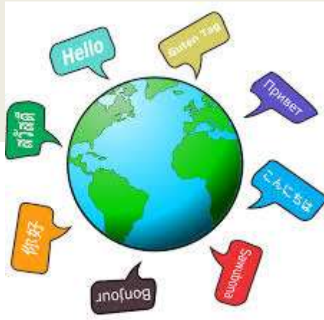
LV53 News, le journal annuel des langues vivantes en Mayenne