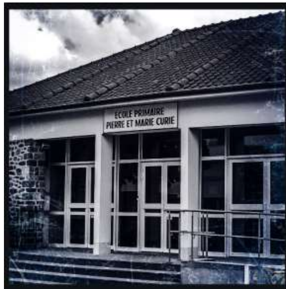
L'école primaire Pierre et Marie Curie (Mayenne) deviendra école bilingue à la rentrée 2021

Si votre école est intéressée par ce type de projet ou souhaite obtenir davantage de renseignements, contactez la CPD LV ( cpdlv53@ac-nantes.fr ou 02 43 59 92 11).