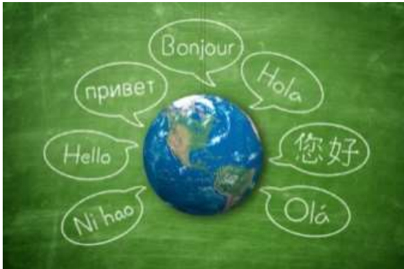
Dossier cycle 1 : voyage autour du monde

Un dossier pédagogique clé en main pour chaque cycle, décliné en 3 versions pour s'adapter au contexte sanitaire. Présentation détaillée, modalités d'accompagnement et coupon d'inscription ici .