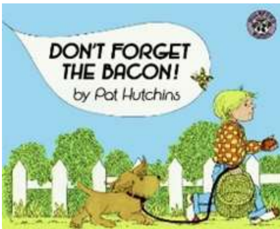
Dossier cycle 3 autour de l'album « Don't forget the bacon! »