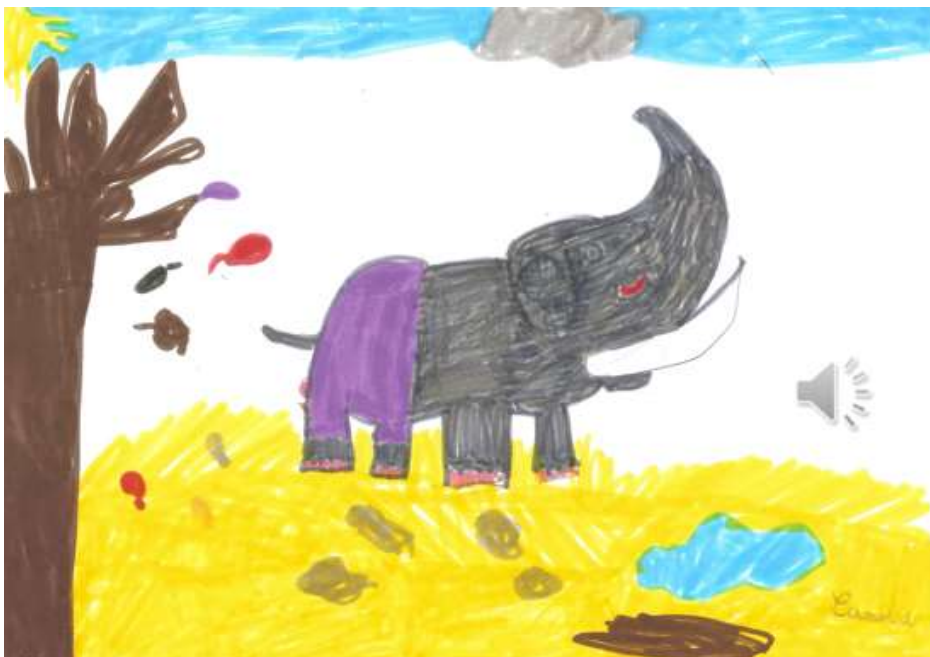
« What colour are your knickers, elephant Myrtle? » (Camille, classe de CE1 de l'école de Bouère)