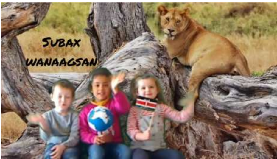
Des élèves de la classe de MS-GS de l'école de Renazé en tournage sur le projet « Voyage autour du monde »