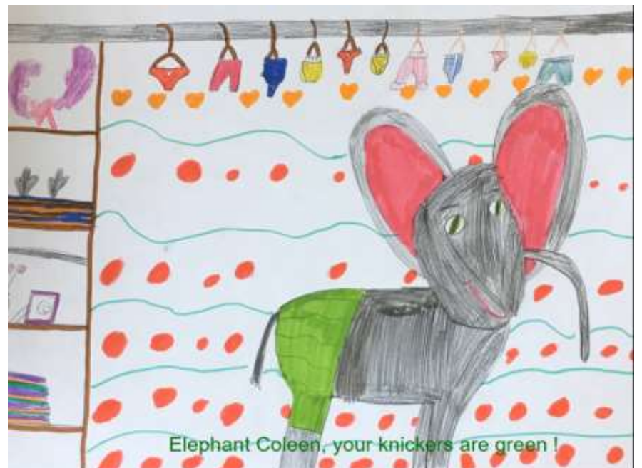
Extrait du livre numérique de la classe de CP-CE1 de l'école de St Georges Buttavent