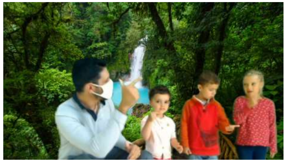
Des élèves de PS-MS-GS et un papa de l'école d'Entrammes comptent en espagnol lors de leur « Voyage autour du monde »