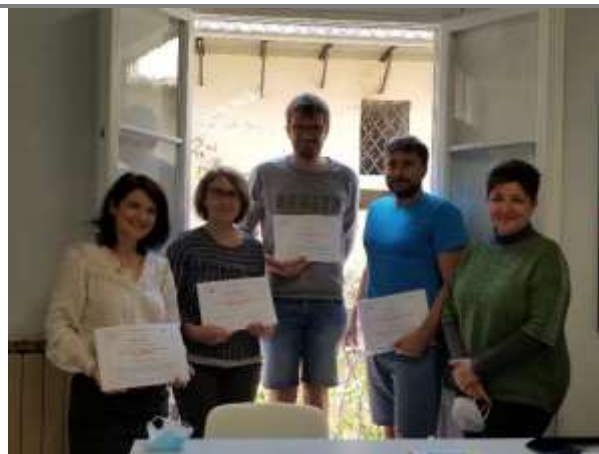
Les stagiaires mayennais et tchèque ont obtenu le « Certificate of attendance » de leur formatrice américaine, à la fin de leur semaine de stage (Italie, mai 2021).

Des appels à projets académiques ont lieu régulièrement à l'initiative de la DAREIC. Si vous êtes intéressé.e.s, contactez la CPD LV 53 ( cpdlv53@ac-nantes.fr ou 02 43 59 92 11).