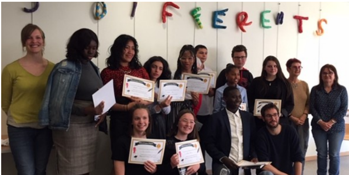
Concours interne d'éloquence